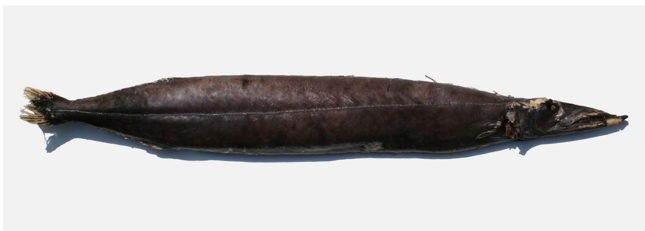
Geddetryne fra Larvik, 2011.

Projektet er finansieret af Aage V. Jensen Naturfond