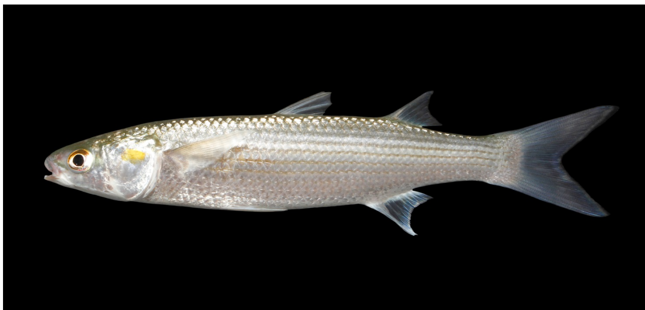
Guldmulte på 23 cm fra Alcudia, Mallorca, 10. juli 2015.

Projektet er finansieret af Aage V. Jensen Naturfond