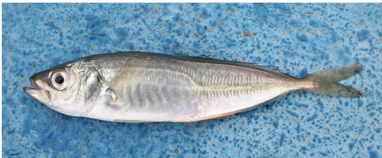
Hestemakrel fra Københavns Havn, 11. september 2005.

Projektet er finansieret af Aage V. Jensen Naturfond