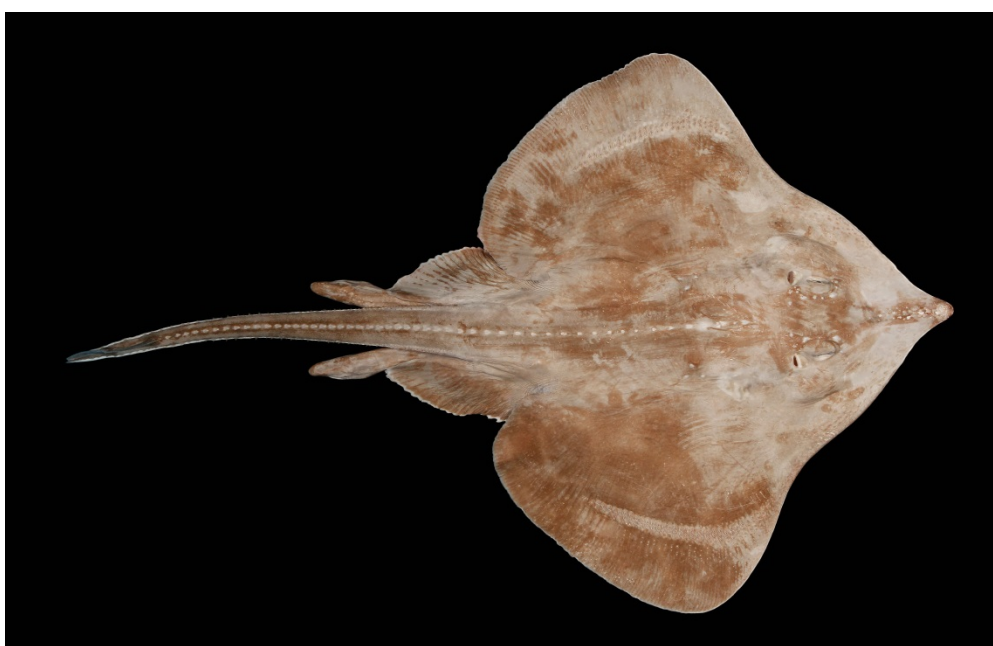
Hvidrokke fra norsk Skagerrak, 24. september 2012.

Projektet er finansieret af Aage V. Jensen Naturfond