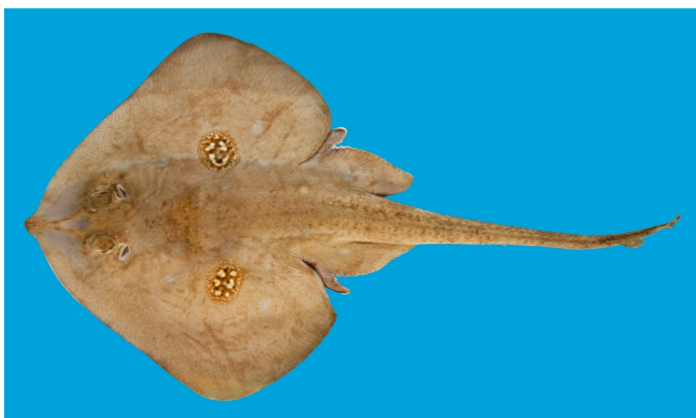
Pletrokke på 48 cm fanget i 2014 (fangstlokalitet ukendt).

Projektet er finansieret af Aage V. Jensen Naturfond