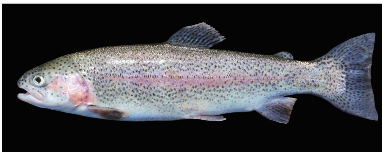
Regnbueørred fra privat sø på Sjælland den 21. april 2018.

Af Henrik Carl & Gorm Heilskov Rasmussen