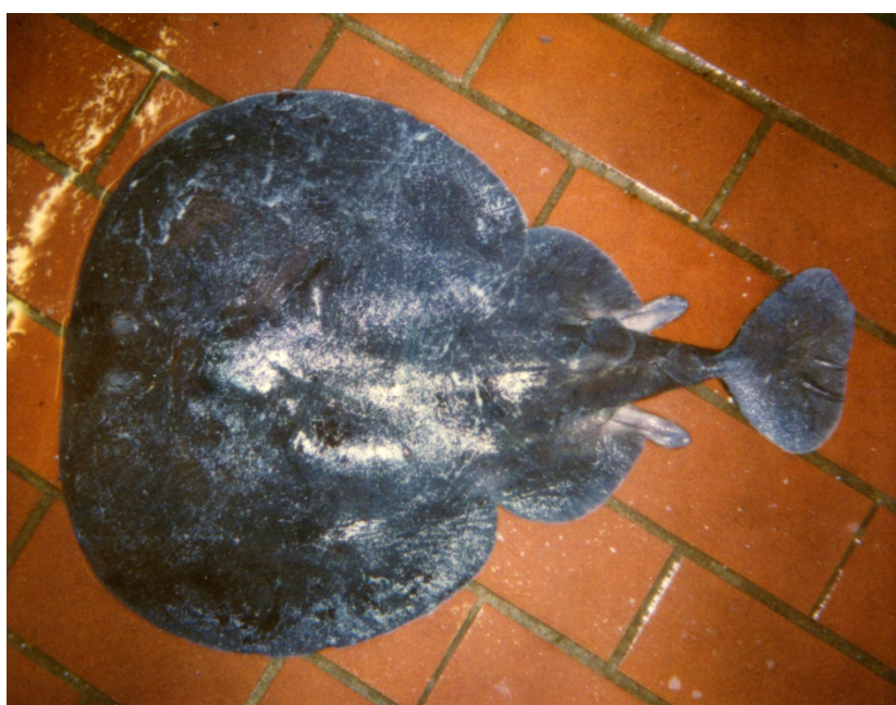
Sort elrokke fanget nord for Læsø den 14. november 1990. Arkivfoto.

Projektet er finansieret af Aage V. Jensen Naturfond