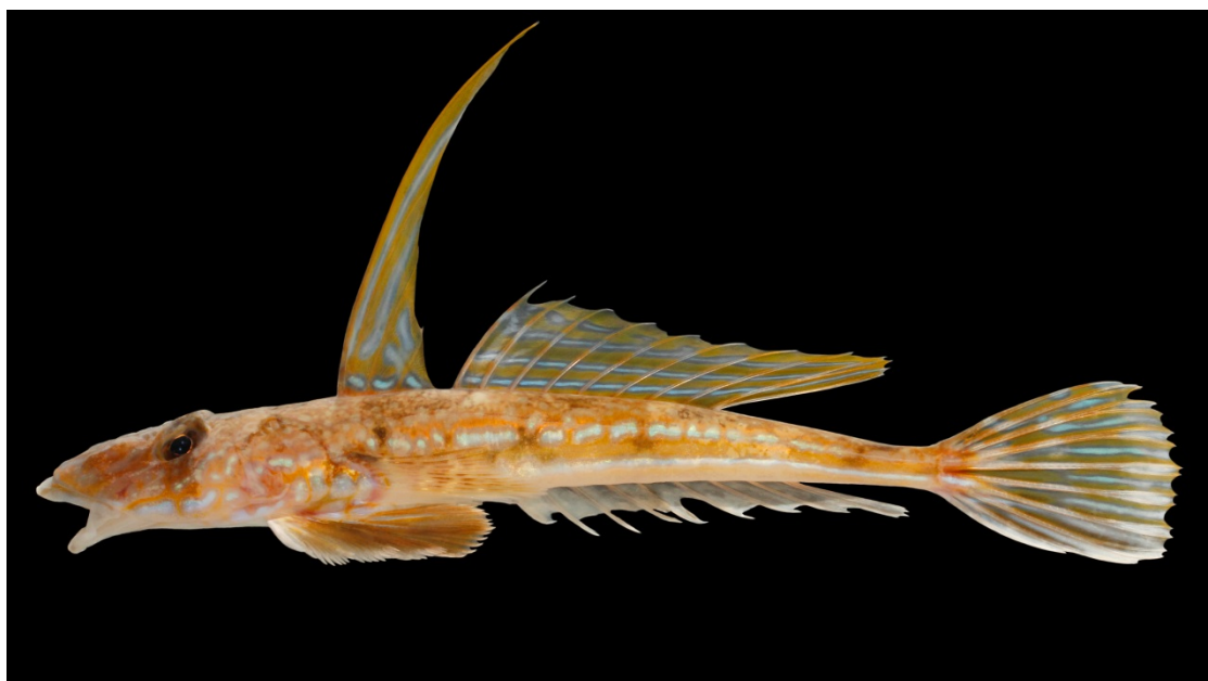
Stribet fløjfisk-han på 19,9 cm fra Nordsøen, 22. november 2013.

Projektet er finansieret af Aage V. Jensen Naturfond